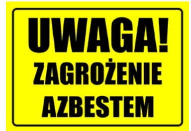
Rys. 2. Tablica informacyjna