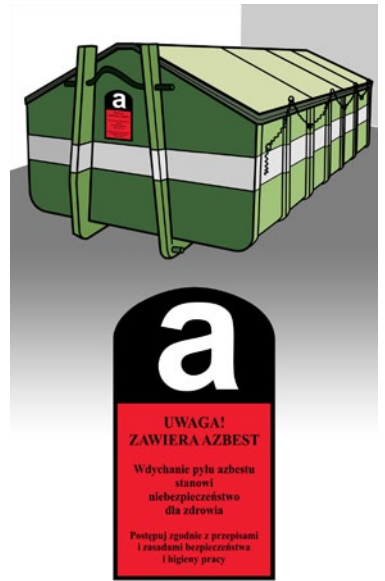
Rys. 4. Usuwanie odpadów azbestowych