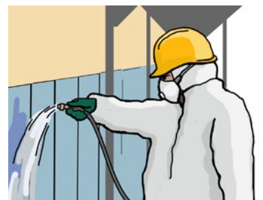
Rys. 3. Nawilżanie materiałów zawierających azbest